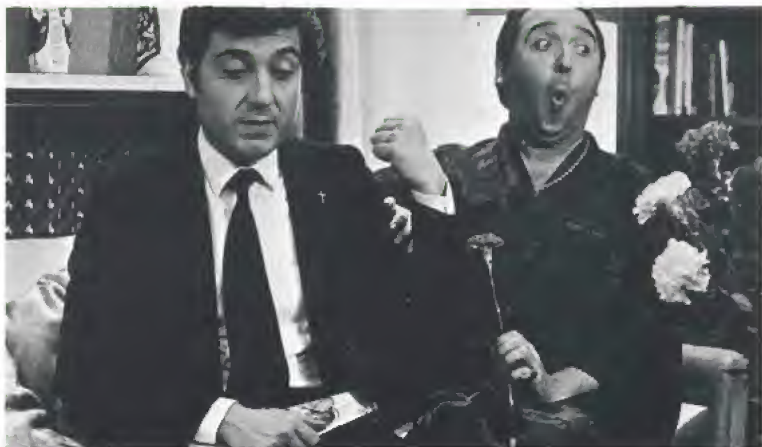
Andrés Pajares – Fernando Esteso